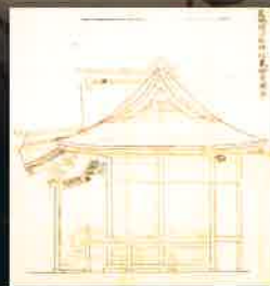
出早雄小萩神社（岡谷市）拝殿